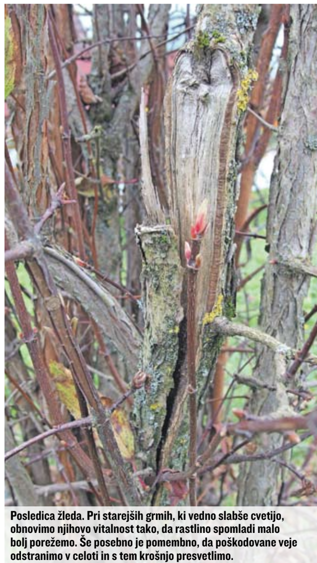
Posledica žleda. Pri starejših grmih, ki vedno slabše cvetijo, obnovimo njihovo vitalnost tako, da rastlino spomladi malo bolj porežemo. Še posebno je pomembno, da poškodovane veje odstranimo v celoti in s tem krošnjo presvetlimo.

Grmiček dišeče brogovite, ki ga lahko kupimo v drevesnici s koreninsko grudo v loncu ali sami razmnožimo s potaknjenci, je na vrt najboljše posaditi že