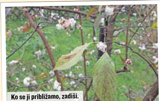
Ko se ji približamo, zadiši.

Vonj bodnantske brogovite je za odtenek močnejši kot pri dišeči brogoviti. Če imate dovolj prostora, bosta obe vrsti rastlin skupaj tvorili najlepše ozadje za brsteče spomladanske čebulice, kot so tulipani in narcise. Vsekakor bosta Viburnum x bodnantense 'Dawn' in Viburnum farreri srečni sosedi, ki spadata na dobro vidno mesto na vrtu. Privoščite si tak pogled skozi okno dnevne sobe in svoj vrt občudujte tudi pozimi.