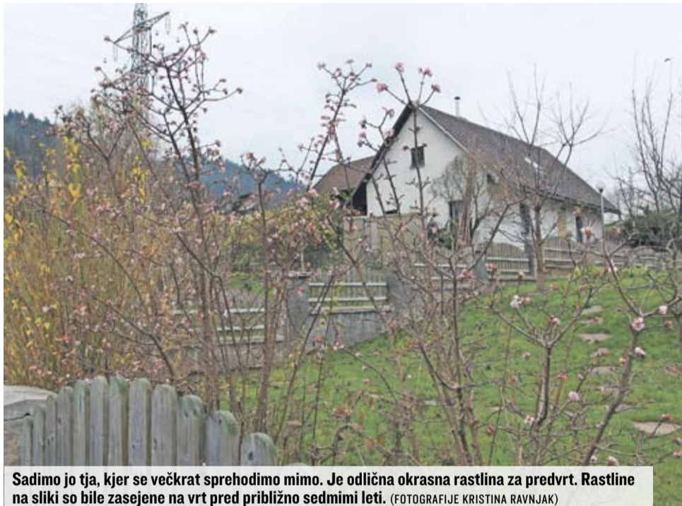
Sadimo jo tja, kjer se večkrat sprehodimo mimo. Je odlična okrasna rastlina za predvrt. Rastline na sliki so bile zasejene na vrt pred približno sedmimi leti.

Dišeča brogovita ima pokončno rast in lokasto obliko krošnje. Mlad grmiček je najlepši, če je posajen pred temno zeleno ozadje tise ali kakšnega drugega iglavca v minimalni razdalji dveh metrov. V vmesnih toplejših obdobjih zime s svojim vonjem prav preseneča, v polnosti pa se razcveti marca ali aprila. Po cvetenju rastlini porežemo poškodovane ali pregosto zrasle veje. Čeprav drobno,