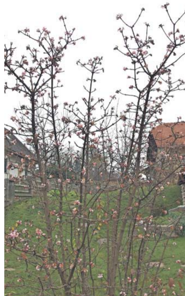
Dišeča brogovita, ki je spomladi redno strižena, nima tipične lokaste oblike krošnje, a je tudi ta gojena (bolj pokončna) oblika povsem sprejemljiva.