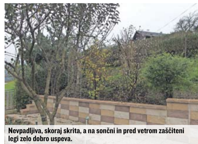
Nevpadljiva, skoraj skrita, a na sončni in pred vetrom zaščiteni legi zelo dobro uspeva.

V vmesnih toplejših obdobjih zime s svojim vonjem prav preseneča, v polnosti pa se razcveti marca ali aprila.